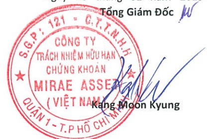
Kang Moon Kyung